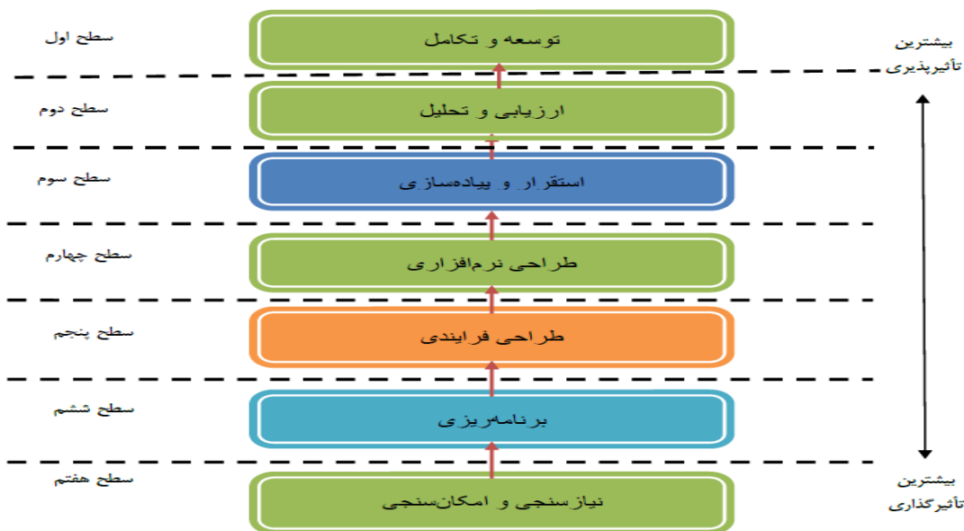
شکل ۱. مدل مضامین سازمان دهنده توسعه داشبورد سازمانی با منطق هوش تجاری

همان‌گونه که مشاهده می‌شود مجموعه خروجی و مجموعه مشترک مؤلفه هفتم یعنی نگهداری و توسعه یکسان هستند. لذا این مؤلفه در سطح یک عوامل مؤثر بر توسعه داشبورد سازمانی با منطق هوش تجاری قرار می‌گیرد. یعنی این مؤلفه تأثیر چندانی بر دیگر مؤلفه‌ها ندارند. با حذف این مؤلفه و حذف شماره آن از مجموعه‌ها می‌توان مؤلفه‌های سطح دو را شناسایی نمود. پس از حذف مؤلفه‌های سطح دو و شماره‌های آن مؤلفه‌ها از