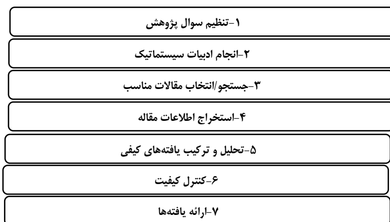
شکل ۲. گام‌های فرا ترکیب (ساندوسکی و باروس، ۲۰۰۷)

ترکیب، مرور یکپارچه ادبیات کیفی موضوع مورد نظر نیست، بلکه تجزیه و تحلیل یافته‌های این مطالعه‌ها است. به عبارتی‌دیگر، فراترکیب، ترکیب و تفسیری از تفسیرهای داده‌های اصلی مطالعه‌های منتخب است. به منظور تحقق هدف پژوهش که همان آسیب‌شناسی پژوهش‌های گذشته در حوزه