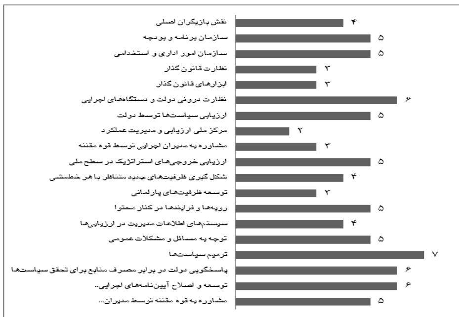
نمودار ۱. فراوانی رویکردها نسبت به مدیریت عملکرد در سطح دولت