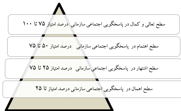
نمودار ۲. هرم درصد امتیاز سازمان از نظر پاسخ‌گویی اجتماعی

محرك برای یک نوع التزام سازمانی در قبال مسئولیت‌های اجتماعی، ارایه سطح بندی، تعیین موقعیت و جایگاه سازمان از نظر وضعیت پاسخ‌گویی اجتماعی اش نسبت به مدل یا سازمان‌های دیگر ضرورت دارد که جهت تسهیل این امر می‌توان از هرم امتیاز ذیل بهره‌جست که از نتایج پژوهش است در این هرم موقعیت درصد امتیاز تا ۲۵ به نام سطح اهمال، درصد امتیاز از ۲۵ تا ۵۰ به نام سطح اشتها یا متوسط، درصد امتیاز از ۵۰ تا ۷۵ به نام سطح اهتمام یا خوب و درصد امتیاز ۷۵ تا ۱۰۰ به نام سطح کمال یا عالی نام گذاری شده است.