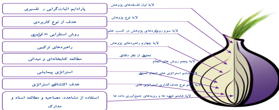
شکل ۱. بیان مختصر و تصویری لایه‌های روش تحقیق حاضر براساس پیاز پژوهش دانایی‌فرد و همکاران (۱۳۸۳)

ارائه شد. بدین صورت که پس از کسب شناخت لازم مبانی علمی و مدل‌های موجود، مصاحبه‌های اکتشافی و عمیق با خبرگان، متخصصین امر و استادان مطرح در حوزه خط‌مشی‌گذاری و کارآفرینی و همچنین برخی از سیاست‌گذاران مطلع و آگاه در حوزه صنایع نفت و گاز انجام شد که طی آن مهمترین مؤلفه‌ها و شاخص‌ها شناسایی و احصا گردید. در این مسیر ابعاد براساس ادبیات تحقیق جمع‌آوری گردید، اما مؤلفه‌ها و شاخص‌ها با توجه به تخصصی بودن آنها در حوزه نفت و گاز، کاملاً محقق ساخته بود، البته با الهام از ادبیات شکل گرفتند و سپس با بهره‌گیری از تکنیک دلفی طی چند مرحله رفت‌وبرگشت حضوری و غیرحضوری با ابعاد، مؤلفه‌ها و شاخص‌ها اصلاح و ارتقا یافتند. پس از تأیید و ارائه پیشنهاد‌های لازم جهت بهبود مدل مفهومی اولیه از طریق