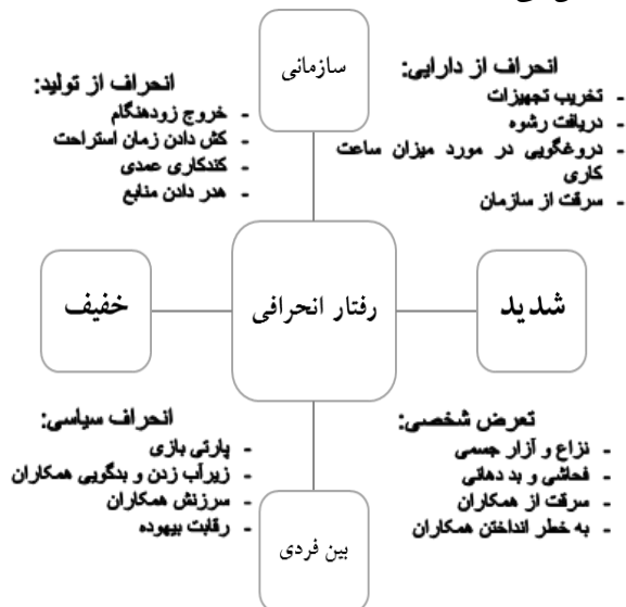
نمودار ۲. انواع رفتارهای انحرافی در سازمان

اساس رفتارهای انحرافی در چهار گروه انحراف از تولید، انحراف از دارایی، انحراف سیاسی و تعرض شخصی نام‌گذاری می‌شود. نمودار ۲-۲ این رفتارهای انحرافی را در این چارچوب نشان می‌دهد.