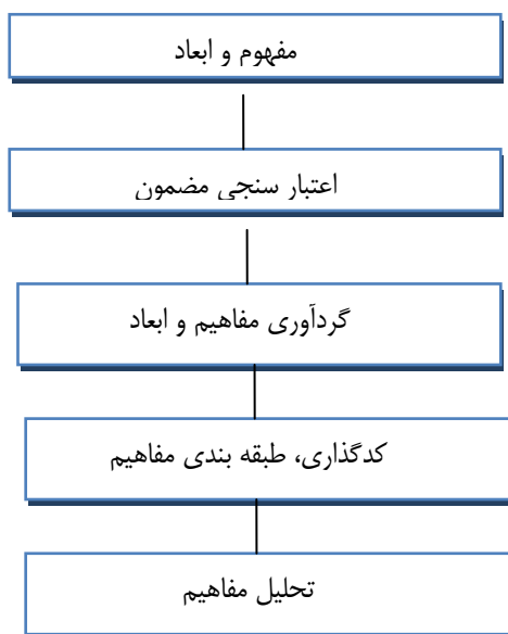
شکل ۱. فرایند انجام پژوهش

فرایند روش تحقیق در شکل شماره ۱ نشان داده شده است: