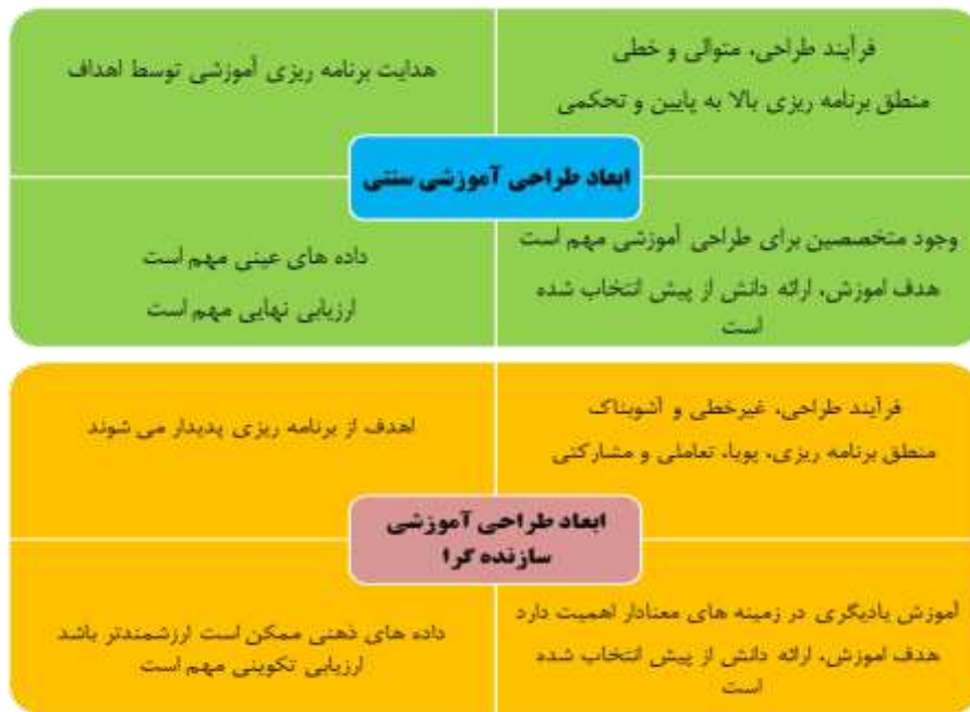
۳. ابعاد طراحی آموزشی سنتی و سازنده‌گرا

با شناخت فرایند مزبور، در طراحی آموزشی نوین به‌ویژه از منظر قیاس با روش‌های سنتی طراحی آموزشی، رویکردهای