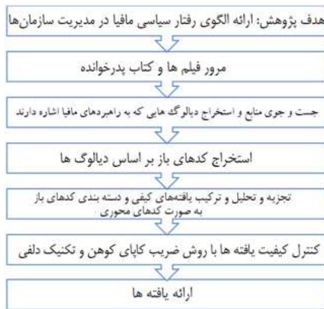
شکل ۱. فرایند پیاده‌سازی روش پژوهش

سه‌گانه، به استخراج و بررسی کدهای باز از هر دیالوگ پرداخته شد. این تحلیل کمک می‌کند تا الگوهای رفتاری و استراتژی‌های قدرتی که در دل این روایت‌ها نهفته است شناسایی شود و از آنها برای تقویت رفتارهای سیاسی سازنده در مدیریت سازمان‌ها بهره‌برداری شود. در ادامه نمونه‌ای از دیالوگ‌های برگرفته از کتاب و فیلم سه‌گانه پدروخواننده، نمایش داده شده است، برای هر دیالوگ یک مؤلفه (کد باز) نیز نامگذاری شده است.