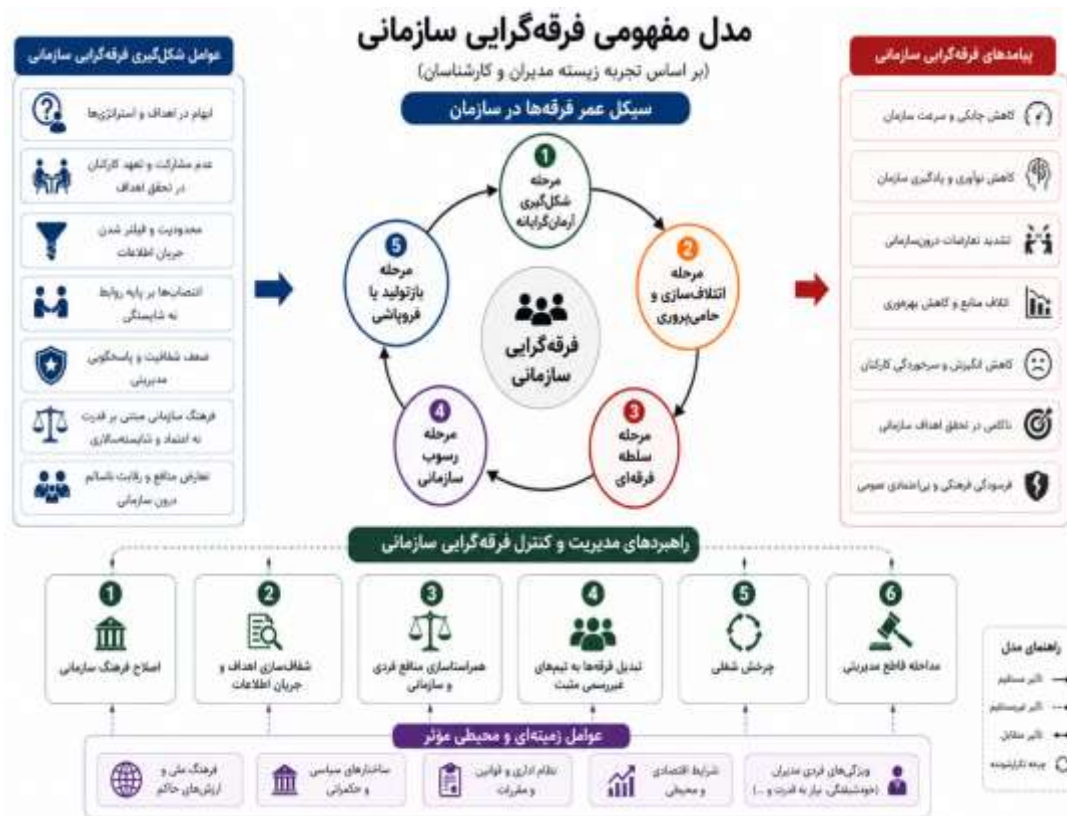
شکل ۱. مدل مفهومی فرقه‌گرایی سازمانی