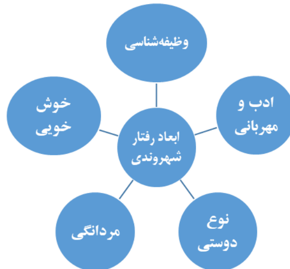
شکل ۱. حیطه‌های رفتار شهروندی سازمانی

بودند از: متغیرهای مرتبط با شغل نظیر رضایت‌مندی شغلی، یکنواختی شغلی و باز خود شغلی درخصوص متغیرهای شغلی تحقیقات عمدتاً حول مبحث تئوری جانشین‌های رهبری بوده