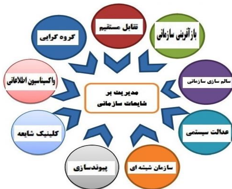
شکل ۳. مدل مفهومی مدیریت بر شایعات سازمانی دانشگاه پیام نور

هدف پژوهش حاضر طراحی الگوی مدیریت بر شایعات سازمانی در سازمان‌های دولتی (مطالعه موردی: دانشگاه پیام نور) بود. سؤال اصلی پژوهش این بوده که مدل مفهومی مدیریت بر شایعات سازمانی در دانشگاه پیام نور چگونه بوده است؟ برای پاسخ به این سؤال، نیاز به پاسخگویی به سؤالات