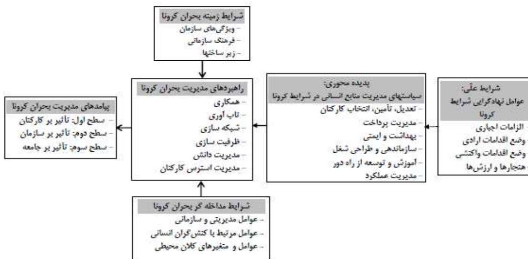
شکل ۳. الگوی راهبردهای مدیریت بحران کرونا مبتنی بر سیاست‌های مدیریت منابع انسانی

مرحله کدگذاری در نظریه داده‌بنیاد، کدگذاری انتخابی است. به این ترتیب که طبقه محوری را به شکل نظام‌مند به دیگر طبقه‌ها ربط داده و آن روابط را در چارچوب یک روایت ارائه سومین کرده و طبقه‌هایی را که به بهبود و توسعه بیشتری نیاز دارند اصلاح می‌کند. در این مرحله پژوهشگر بر حسب فهم خود از متن پدیده مورد مطالعه، یا چارچوب مدل پارادایم را