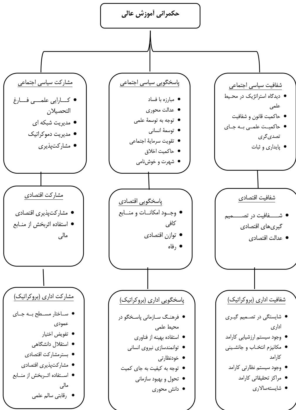
شکل ۲. مدل پیشنهادی پژوهش جهت حکمرانی آموزش عالی